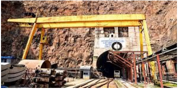
రఘూ అసర్దేన్ కు తాత్కాలిక భేష్

ఆంధ్రప్రదేశ్ : ఎన్ఎల్బీసీ టన్నెల్ లో రెస్క్యూ ఆపరేషన్లు శనివారం నిలిపి వేశారు. ఎన్ఎల్బీసీ సారంగంలో ఫిబ్రవరి 22న ప్రమాదం జరిగి ఎనిమిది మంది గల్లంతయ్యారు. ప్రమాదం జరిగిన నాటి రెస్క్యూ ఆపరేషన్ చేపట్టారు. ఇప్పటి వరకు 63 రోజులుగా అవిశ్రాంతంగా కొనసాగిన రెస్క్యూ ఆపరేషన్కు శనివారం సుంచి తాత్కాలికంగా బ్రేక్ పడింది. ఇద్దరి మృతదేహాలను వెలికితీసిన రెస్క్యూ సిబ్బంది, మిగిలిన ఆరుగురి అమాకీ కోసం ఆపరేషన్ కొనసాగించారు. అయితే ఇంత వరకు ఆరుగురి అమాకీ లభ్యం కాలేదు.