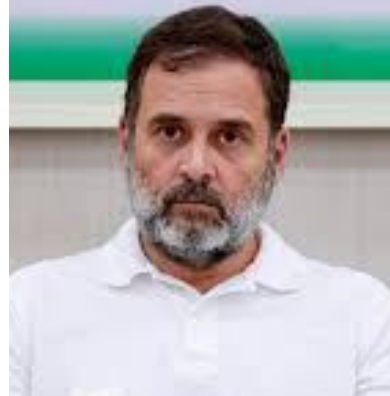
లేవు. వివక్షలను అణగదాక్కుడమే అధికార పార్టీకి వస్తేయింది.

హైదరాబాద్: తెలంగాణ ప్రభుత్వం ఎంతో ప్రతిష్టాత్మకంగా భారత్ సమ్మిట్ 2025 నిర్వహిస్తున్న సంగతి తెలిసిందే. శుక్రవారం ప్రారంభం అయిన ఈ కార్యక్రమంలో 100 దేశాలకు చెందిన 450 మంది ప్రముఖులు పాల్గొన్నారు. సమ్మిట్ చివరి రోజున ఈ గ్లోబల్ కాన్ఫరెన్స్ లో కాంగ్రెస్ పార్టీ జాతీయ నాయకుడు రాహుల్ గాంధీ పాల్గొన్నారు. ఈ సందర్భంగా ఆయన పలు కీలక వ్యాఖ్యలు చేశారు. కేంద్ర ప్రభుత్వంపై మండిపాటు వ్యక్తం చేశారు. రాహుల్ మాట్లాడుతూ.. ‘ ప్రపంచ వ్యాప్తంగా రాజకీయాలు ఎంతో మారిపోయాయి. పదేళ్ల క్రితం నాటి పరిస్థితులు ఇప్పుడు